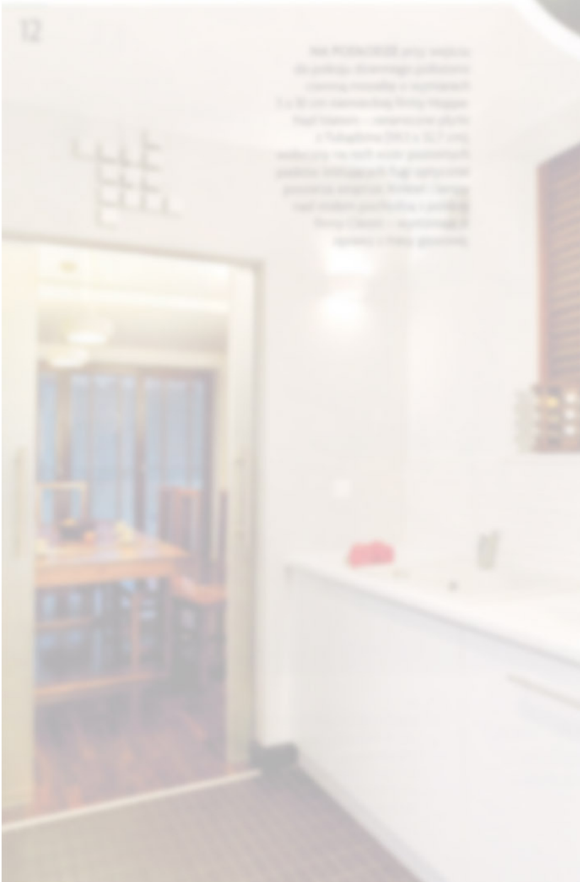
12. Aneks z szklanymi drzwiami w kolorze szarym i białym, który można zamknąć lub otworzyć w zależności od potrzeb.