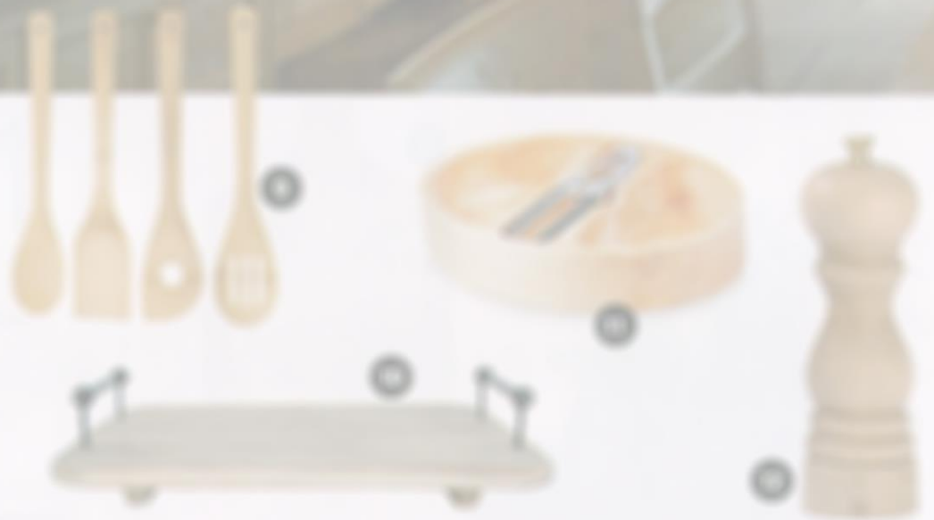
8. Deska do serwowania i krojenia, kolekcja Master Class. Wykonana z drewna mango, wymiary: 77 x 57 x 3,5 cm. 352 zł, KITCHEN CRAFT, www.leduvel.pl/sklep