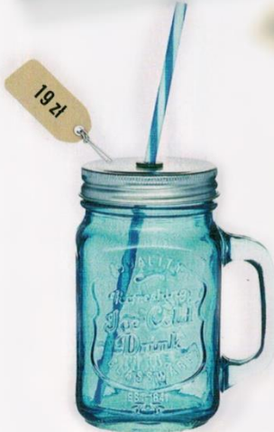
Słoik ze słomką marki Kitchen Craft, szkło, wys. 13 cm, gadodo.pl