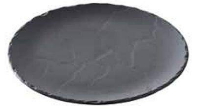
Talerz okrągły BASALT 26,8 cm. Jedyny taki: wykonany w 100% z czarnej porcelany, ma odporność termiczną od -20 do 300°C, 112 zł, REVOL .